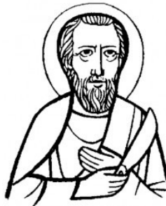
SAN BARTOLOMEO apostolo

In preparazione alla festa di San Bartolomeo Natanaele ricordiamo i prossimi appuntamenti, prima e dopo il 24 Agosto, giorno del Patrono: